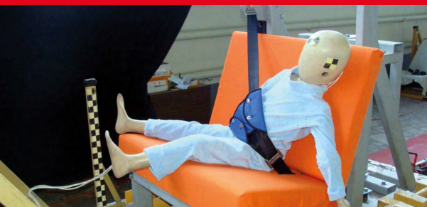
Результаты тестов использования небезопасных удерживающих устройств*

Дополнение определения «направляющая ляжка» в Правилах ЕЭК ООН № 44-04 было одобрено Всемирным Форумом (WP.29). Внесенная поправка к формулировке указывает на то, что «направляющая ляжка» рассматривается как составной элемент детской удерживающей системы и НЕ может отдельно официально утверждаться в качестве детской удерживающей системы в соответствии с настоящими Правилами». Это исключает даже формальную возможность сертификации устройств типа «направляющая ляжка»!