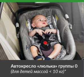
Автокресло «люлька» группы 0 (для детей массой < 10 кг)*

При покупке детского удерживающего устройства обязательно следует уточнить у продавца наличие сертификата на товар!