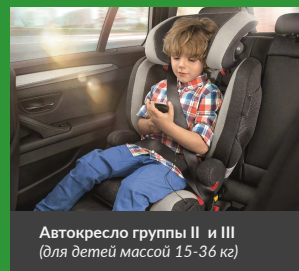
Автокресло группы II и III (для детей массой 15-36 кг)