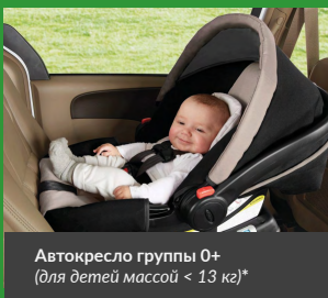
Автокресло группы 0+ (для детей массой < 13 кг)*