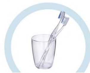
ТУАЛЕТНЫЕ ПРИНАДЛЕЖНОСТИ (ЗУБНЫЕ ЩЕТКИ, РАСЧЕСКИ И ПР.)