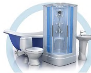
ТУАЛЕТ (УНИТАЗ, ВАННА, ДУШЕВАЯ КАБИНА, БИДЕ)