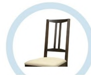
СПИНКИ СТУЛЬЕВ, НЕ ОБИТЫЕ ТКАНЬЮ И МЯГКИМ ПОРИСТЫМ МАТЕРИАЛОМ