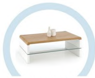
ЖУРНАЛЬНЫЕ СТОЛИКИ И ПРОЧИЕ ЖЕСТКИЕ ПОВЕРХНОСТИ